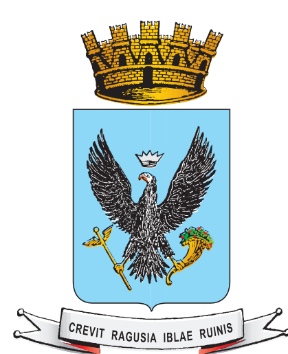
Comune di Ragusa