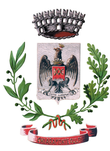
Comune di Chiaramonte