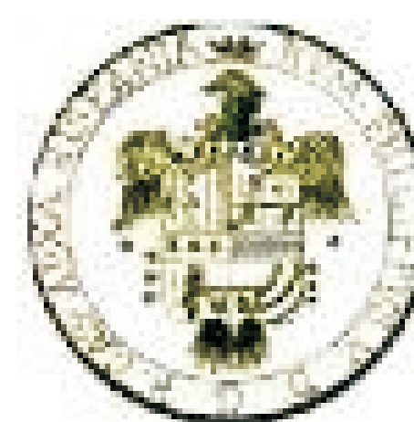
Comune di Monterosso